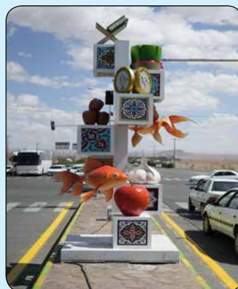
المان هفت سین تقاطع امام رضا (ع) و شهید ناصری