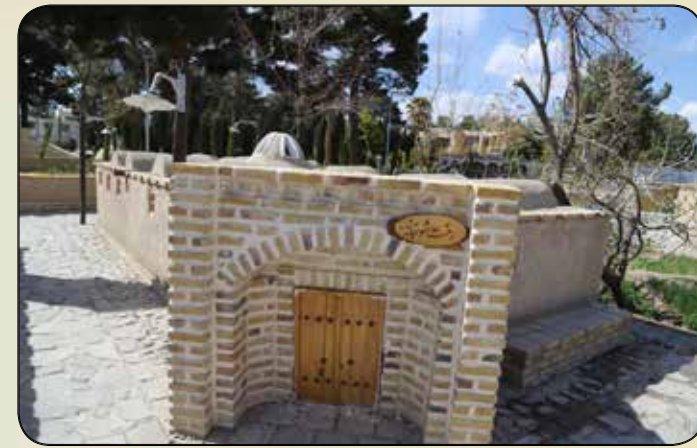
المان رخت شوخانه