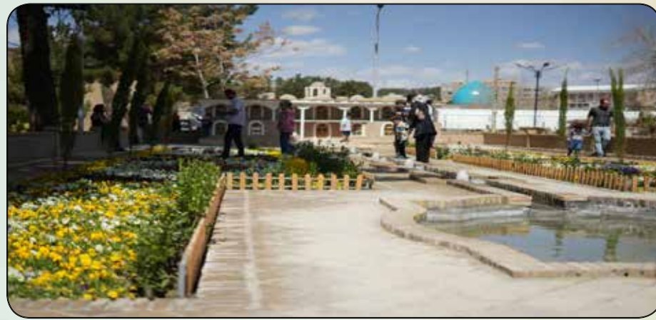
المان باغ و عمارت ایرانی