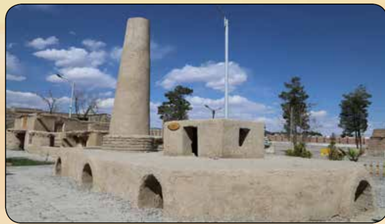
المان کوره آجرپزی (هوفمان)