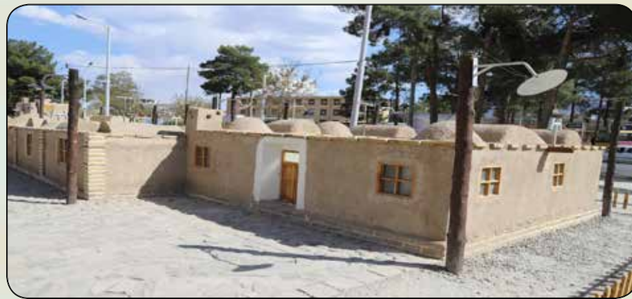
المان خانه قدیمی