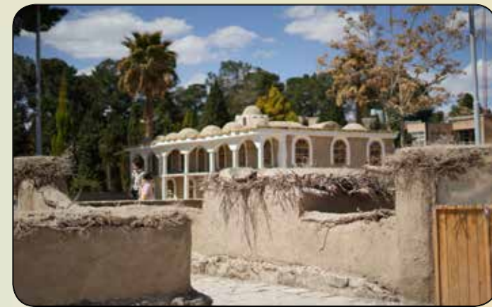
المان کوچه قدیمی