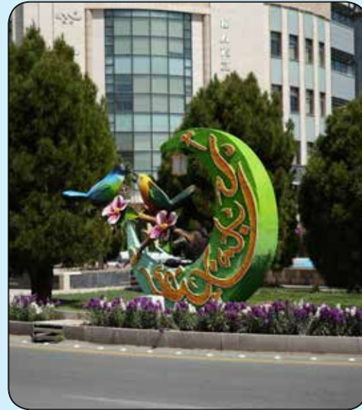
المان ماه مبارک رمضان میدان طالقانی