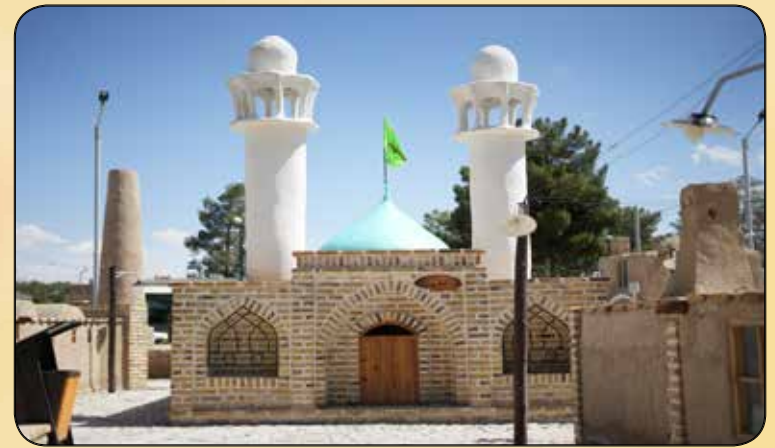
المان مسجد جامع