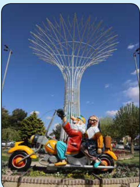
المان عمو نوروز و ننه سرما / میدان ابوذر