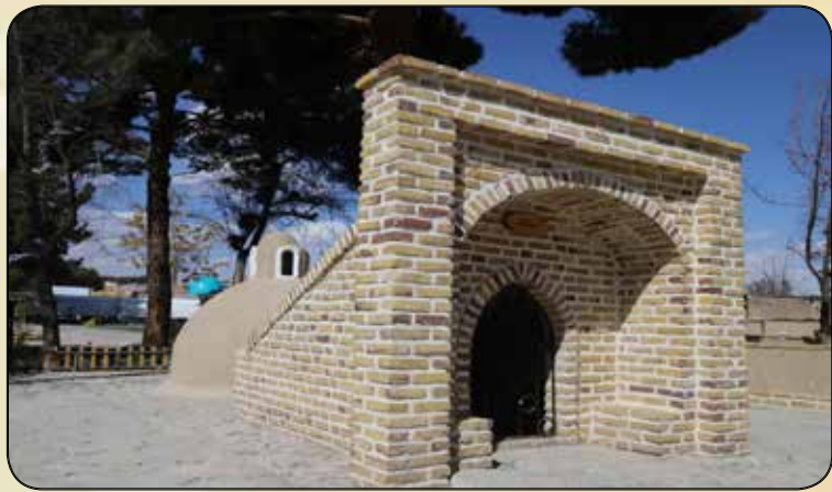
المان آب انبار