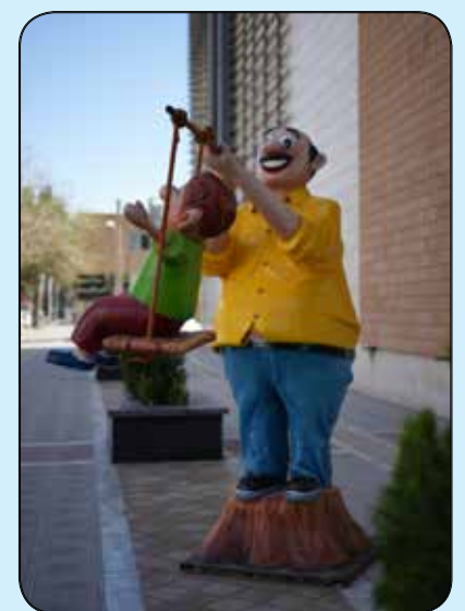
المان تاب بازی / خیابان طالقانی