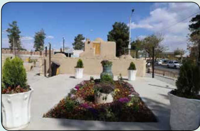
المان فرش گل