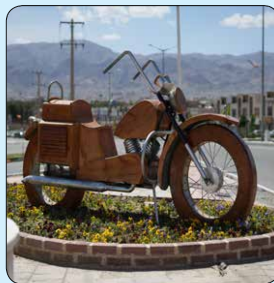
المان موتورسیکلت چوبی / بلوار شهید صیاد