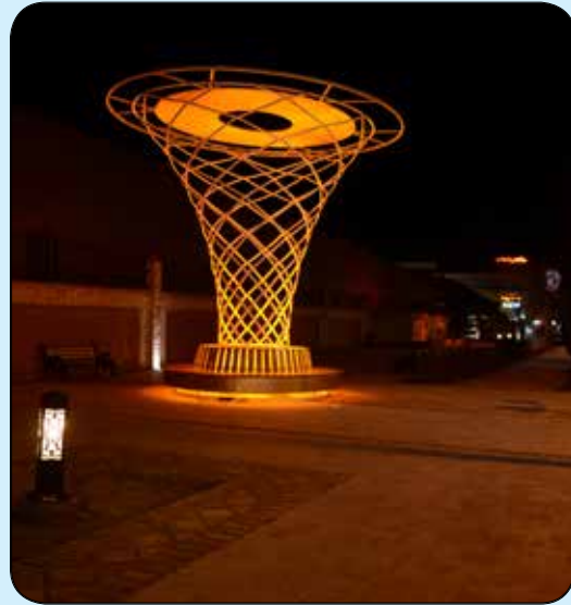
المان های نیمکت گروهی نورانی حاشیه دیوار یخی محلاتی و بلوار طبیعت و میدان ابوذر