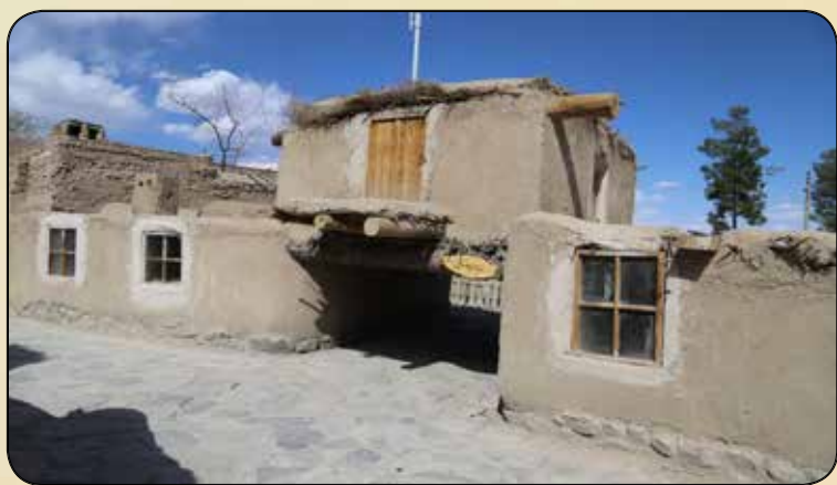
المان ساباط روستایی