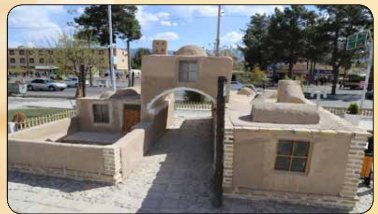
المان ساباط شهری