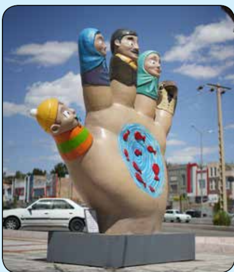
المان لی لی حوضک / بلوار ارتش