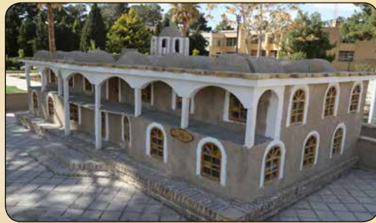
المان عمارت کوشک