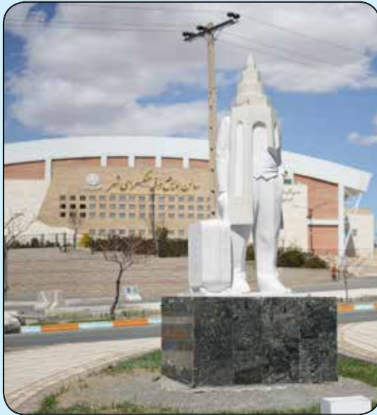
المان توریست و ابنیه تاریخی بیرجند تقاطع صیاد شیرازی و شهید قرنی