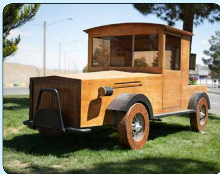
المان خودروی کلاسیک چوبی / تقاطع غفاری و ارتش