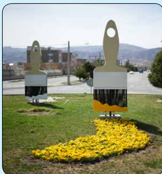
المان قلم موی رنگی میدان امام صادق (ع) سجادشهر