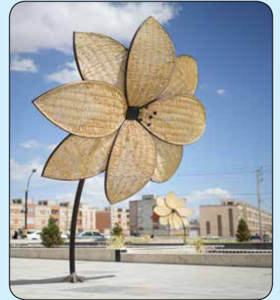
المان دسته گل ارغوان بافی میدان آیت... مصباح (مهرشهر)